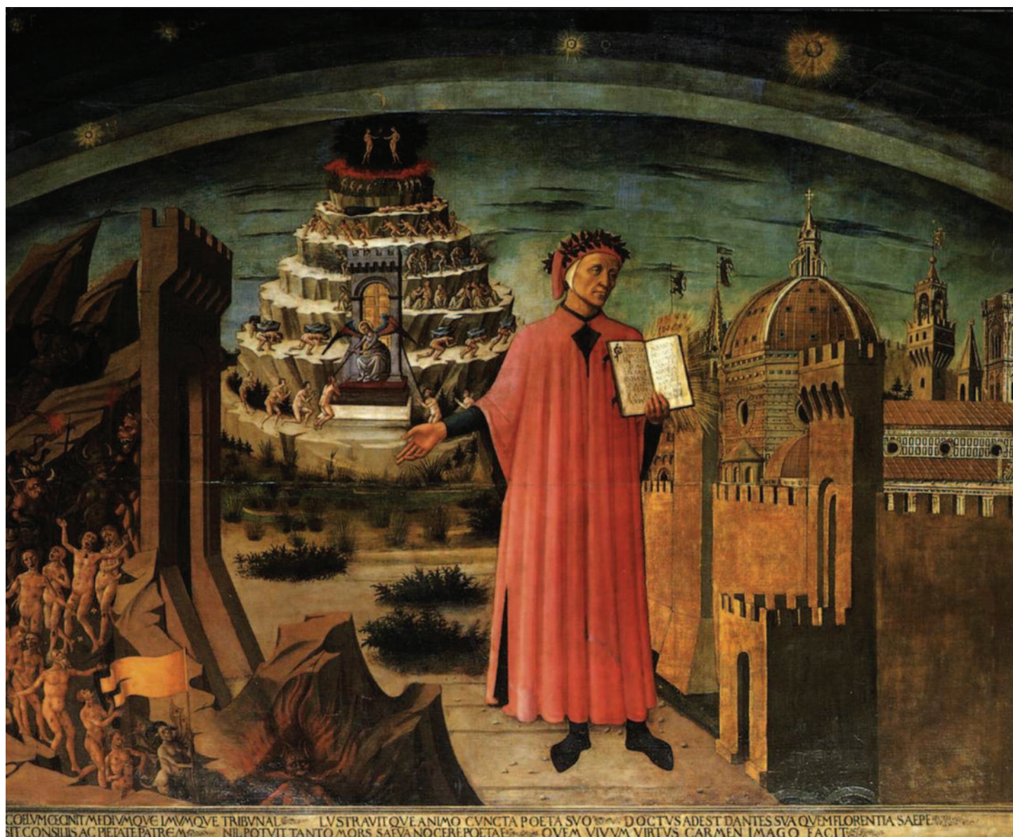
De Goddelijke Komedie van Dante Alighieri

De fysieke dood went nooit als het gaat om een verlies van een dierbare. En aangezien de dood geen agenda heeft, komt deze op een of andere manier altijd ongelegen binnen een familie. Dit is de dood die gekoppeld is aan onze hedendaagse Gregoriaanse kalender en klok. Wat er achter de coulissen van de dood gebeurt, komt niet zo vaak aan het licht. Of nog erger, het wordt soms afgedaan als onzin. Toch hebben fenomenale voorouders oude en erkende geschriften achtergelaten waarbij men in de sferen van gestorvenen mocht kijken. Daarbij mogen we ook zeker de bijna-doodervaringen niet vergeten met de ervaringen die gedeeld worden.