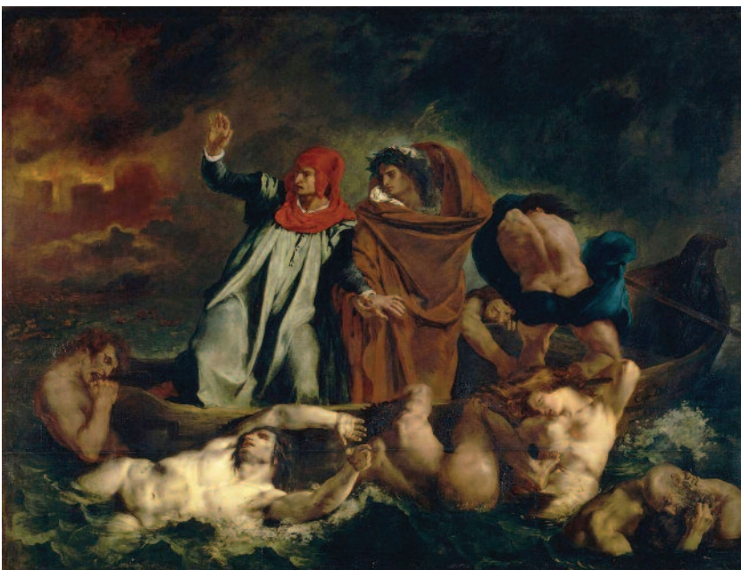
Dante en Vergilius in de Hel van Delacroix

Een interessant thema in het materiaal waar niet zo veel over geschreven wordt, is het sterven van een tweede dood. Als ieder mens op aarde deze wetenschap tot zich neemt, zou er onmiddellijk veel meer vrede zijn. Een tweede dood sterven wordt op meerdere plaatsen beeldschoon beschreven, maar in de geschriften van Emanuel Swedenborg en De Goddelijke Komedie van Dante Alighieri komt het treffend naar voren. Wie denkt dat het na de fysieke dood